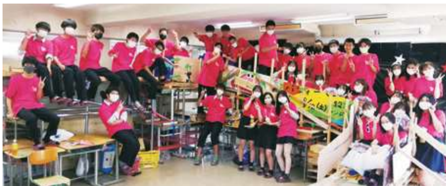
合唱コンクールの練習風景▷◁