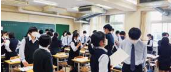
△英語授業（ペアワーク）