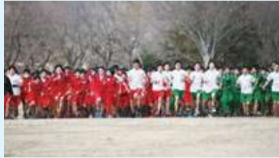
△ロードレース大会（持久走大会）