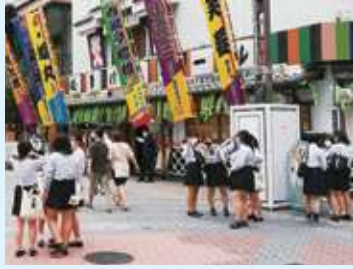
△ 芸術鑑賞教室 ▽