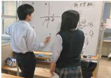
◁自習コーナーの様子