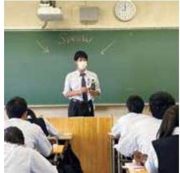
△英語授業（プレゼンテーション「自分のお気に入り」）