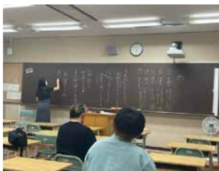
基礎を中心とした授業