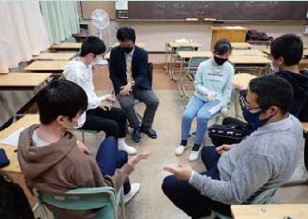
グループエンカウンター