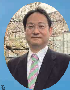
東京都立大山高等学校長

「勉強は未来への投資」と言われます。しかもローリスク・ハイリターンです。大山高校で、共に学びはじめ、自分の未来をつかみましよう。