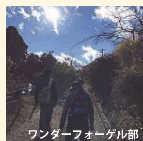
ワンダーフォーゲル部