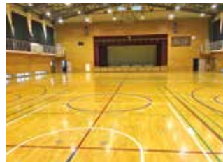
冷暖房が完備された体育館 夏暑い、冬寒い、は過去の話