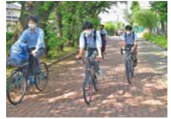
生徒たちはこの並木道を登校 自転車通学が多いです