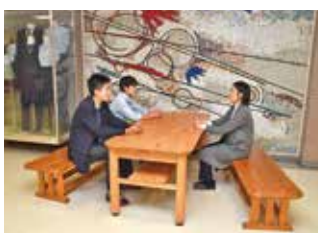
職員室前で先生たちに相談 先生たちは生徒以上に個性豊か

この学校は坂の上に 建っているよ 本校舎と特別棟の階が ずれているので 迷わないように！