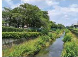
学校の前を流れる黒目川 学校の周りは自然でいっぱい