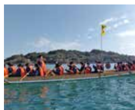
修学旅行(48期生 長崎)