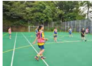
森の中のオールウェザーコート 存在を知らない生徒も多い