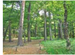
多くの生物が棲む保存林 狸の目撃情報多数！