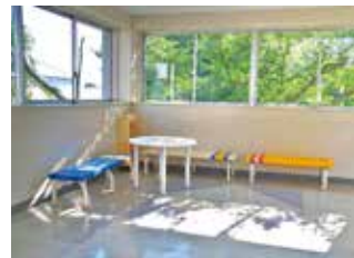
渡り廊下にはベンチもあります 景色もきれいな憩いの場

この学校は坂の上に 建っているよ 本校舎と特別棟の階が ずれているので 迷わないように！