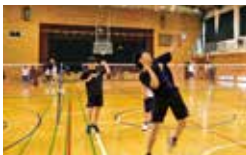
男子バドミントン部