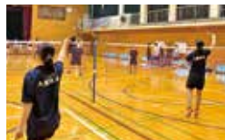
女子バドミントン部