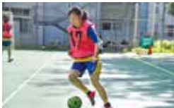
女子フットサル部