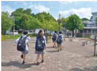
駐輪場から校舎までの長い道 友達とたくさん話しながら