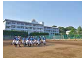
青春の詰まったグラウンド ここで熱い絆が生まれる！