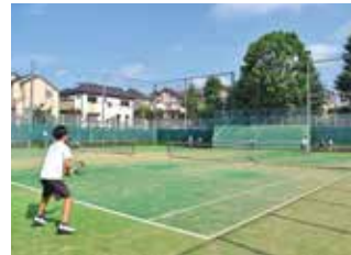
汗と涙を吸ったテニスコート 朝練風景はくるにしの名物