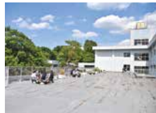
中屋上の解放感はサイコー！ 晴れた冬には富士山が美しい