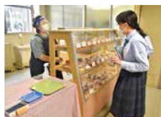
昼休みに腹ペコたちが集う購買 4限が長引くとすでに長蛇の列