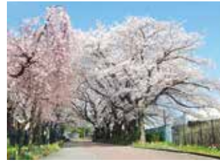
正門からは桜のトンネル！ 春の素敵な景色です