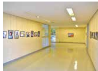
写真部や美術部の作品を展示 くるにしの美術館！