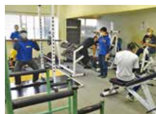
努力と根性のウエイトルーム 筋肉は絶対に裏切らない！