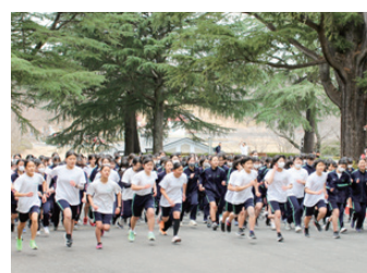
マラソン大会・こどもの国 (横浜市)