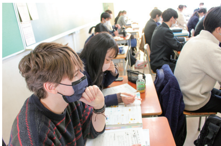
小山台 DAY: 授業体験