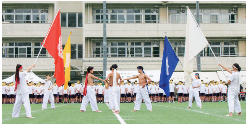
寒菊祭 [運動会]・エールの交換