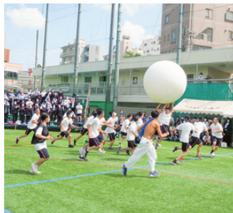
寒菊祭 [運動会]・大玉送り