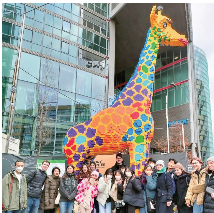
海外体験派遣: ドイツ・ベルリン