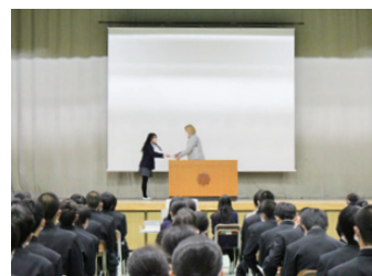
スピーチコンテスト