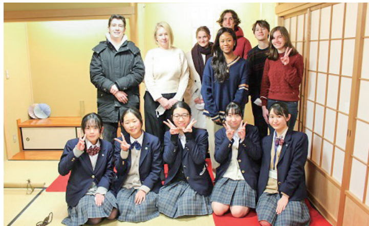
小山台 DAY: 茶道体験

生徒会と各班活動が協力し、「小山台 DAY」を企画実施します。これまでに、ダンス班、剣道班、ホームサークル班、茶道班、ESS班、生徒会、さらに一般生徒も交流行事に参加しました。言葉の壁を越えて心の交流を図るといふ貴重な体験ができました。