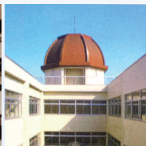
完成直後の現八角塔

八角塔は、旧制八中の「八」の字にちなんで建設され、現在に至るまで本校のシンボルとして親しまれています。