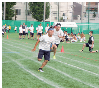
寒菊祭 [運動会]・800メートルリレー