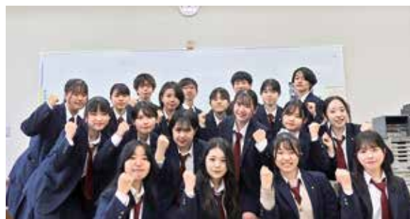
木もれ陽祭実行委員会