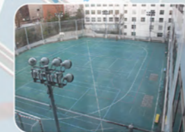
グラウンド：テニスコート3面