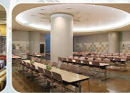
給食室：広いスペースで食事がとれ ます