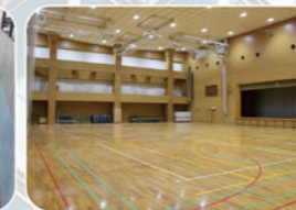
体育館：バスケットコート2面