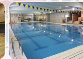
温水プール：25mコース