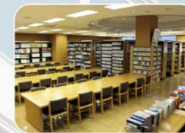
図書館：ゆったりと読書・勉強が できます