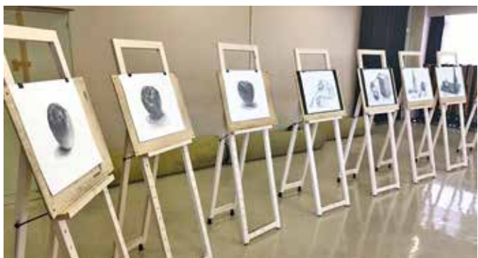
2021 年度 中学生デッサン教室の様子