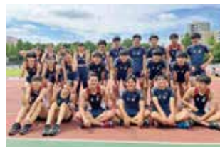
●陸上競技部 16年連続南関東大会出場