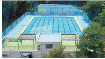
プール改修済 (2016) テニスコート人工芝張替え (2016)