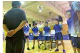
●卓球部 2018 インターハイ出場 2020 東京都新人大会団体ベスト16