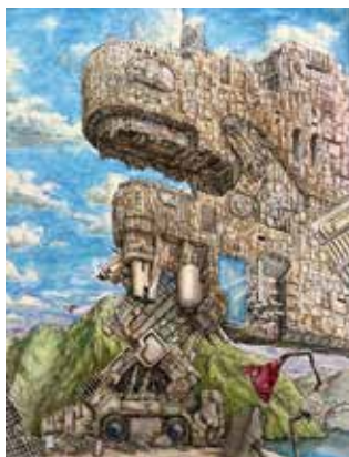
●陶芸・美術部 2021 東京都高等学校総合文化祭 美術・工芸部門『中央展』奨励賞受賞 2022 全国大会『ときょう絵文祭』ブレ大会出場