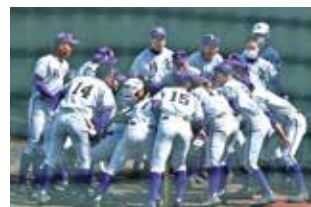
●硬式野球部 2018夏 西東京大会ベスト8 2019春 東京大会ベスト16