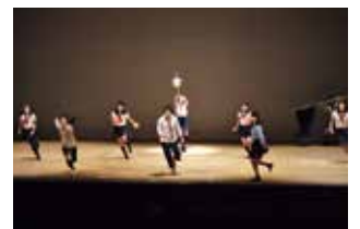
●演劇部 2017 関東大会出場 2018、2019 短編都大会出場 2021 都大会出場