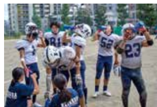
●アメリカンフットボール部 2021 春季大会 「マスタートーナメント優勝」