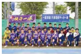
●サッカー部 2019 選手権大会1次トーナメント決勝 2021 東京都U16地区選抜 選出(3名)