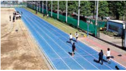
タータン5コースに増設 (2018)