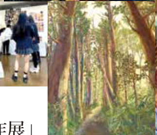
造形美術コース「卒業制作展」