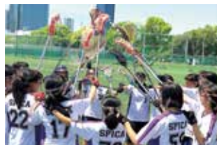
●女子ラクロス部 関東女子中高生ラクロスリーグ戦出場 中高生ラクロス秋季関東大会決勝リーグ出場