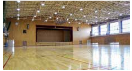
照明LED化 (2016) 空調設置 (2018)