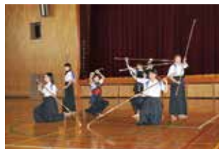
●なぎなた部 2018 関東大会予選団体3位 2020 全国選抜大会出場権獲得