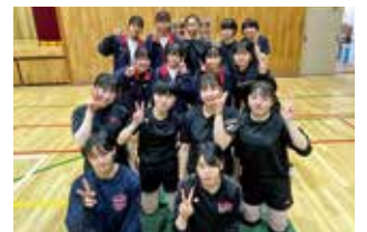
●女子バレー部 2021 インターハイ予選3回戦進出