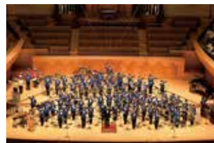
●吹奏楽部 全日本吹奏楽コンクール出場 15回 全日本マーチングバンド世界大会優勝 台湾、韓国、シンガポール招待演奏