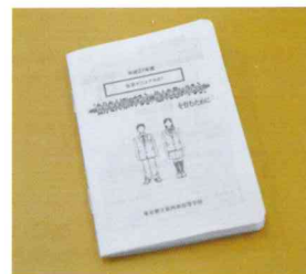
全員に生活マニュアルを配布します。

生徒一人一人を大切にするために、他人に迷惑をかける行為やルール違反に対しては繰り返し厳しく指導していきます。