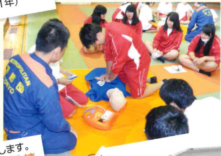
避難訓練を年4回実施します。避難訓練