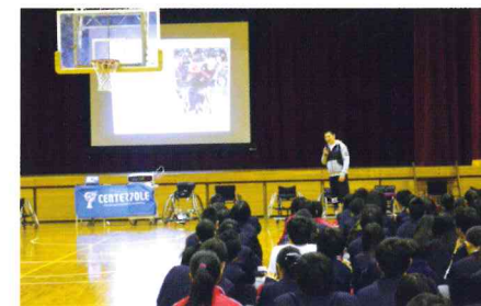
パラアスリート講演会