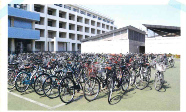
自転車置場 希望者は全員駐輪できます (屋根つきの全天候型もあります)