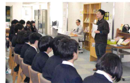
図書館オリエンテーション