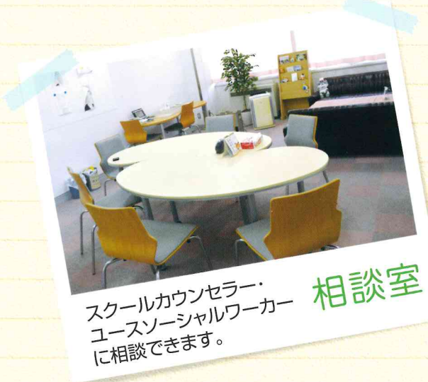
スクールカウンセラー・ ユースソーシャルワーカー に相談できます。 相談室