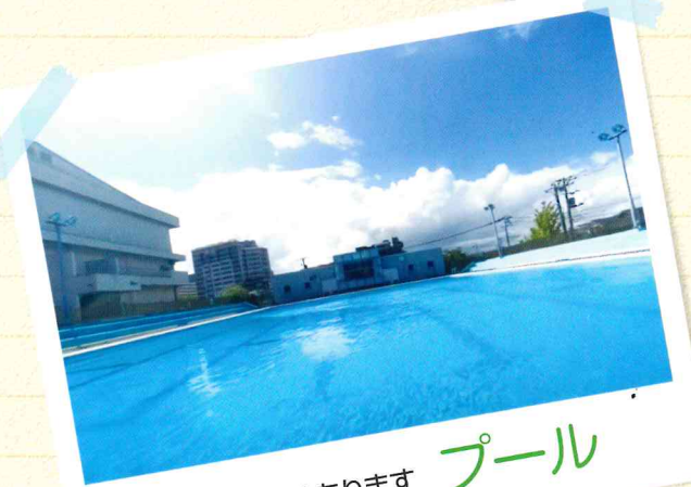
屋外8コースあります プール