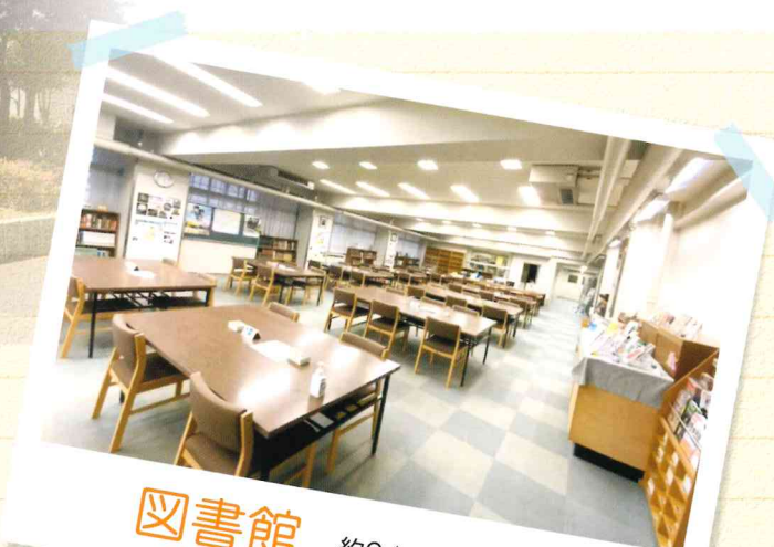
図書館 約24,000冊の蔵書