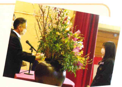
それぞれの旅立ち 卒業式

「総合的な探究の時間」で事前に学習してから、全員が100以上の会社や事業所に分かれて2日間の職場体験をします。学年末に体験発表会をし、体験レポート集を発行します。