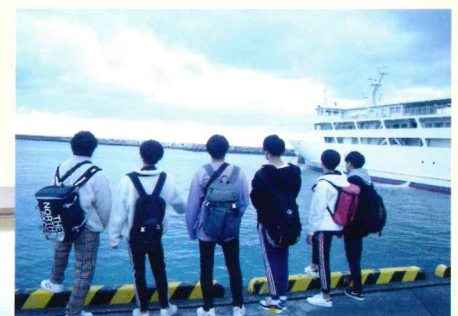
修学旅行 (令和4年度も沖縄の予定)