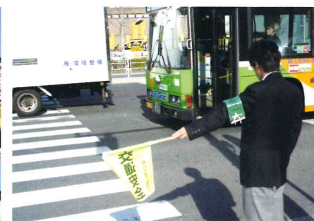
町会の春の交通安全運動のお手伝いをしています。