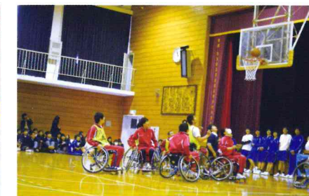
車椅子バスケット体験