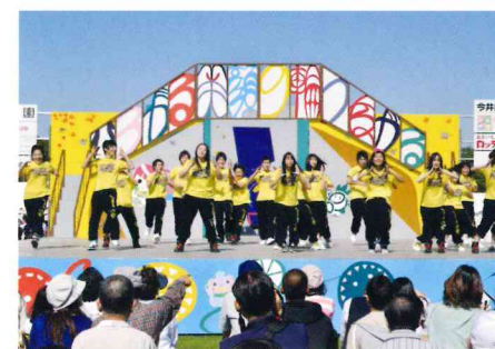
江戸川区民祭りでのダンス部のパフォーマンスです。

本校は、地元警察署や自治会と連携し朝の交通安全運動の支援、保育園に行つての絵本の読み聞かせボランティア、毎月の地域清掃、江戸川区民祭りなどの地域行事への参加などを実施し、地域社会へ積極的に貢献する学校を目指しています。