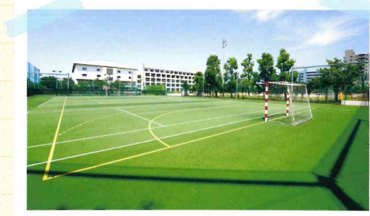
オールウェザーコート テニス2面 ハンドボール1面 (平成24年度全面改修)