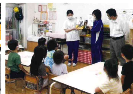
図書委員が園児に読み聞かせをしています。