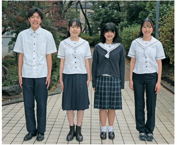
※夏服チェック柄スカートはオプションです。