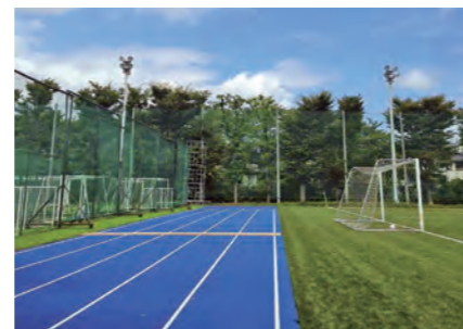
タータントラック