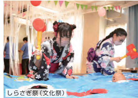
しらさぎ祭(文化祭)