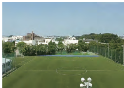
人工芝のグラウンド