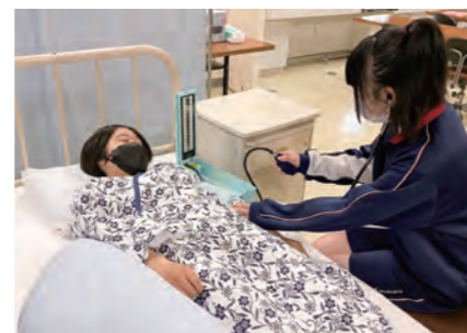
看護・福祉実習室