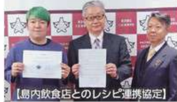
【島内飲食店とのレシピ連携協定】