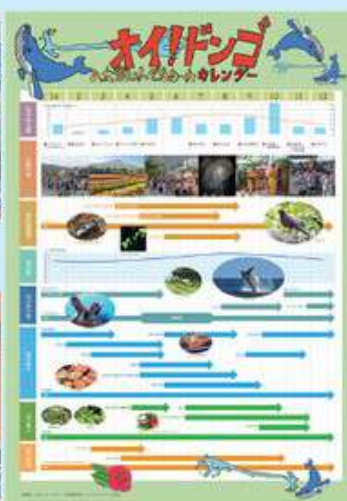
作成したフェノロジーカレンダー (学校HPにて公開中)