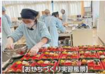
【おせちづくり実習風景】