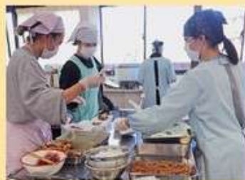
「家政科3年（お弁当実習）」