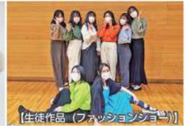
【生徒作品(ファッションショー)】