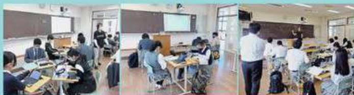
「一人一台端末の活用」