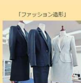
「ファッション造形」