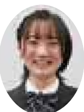
千葉県立保健医療大学健康科学部看護学科 進学 (江東区立深川第六中学校 出身)

私はこの3年間の経験が、将来の自分の助けになると自信をもって言うことができます。しかし、このパンフレットを手にしたみなさんが、深川高校に限らず、行きたい！と感じたところへ進学できることが一番です。望む進路へ進めることを願っています！