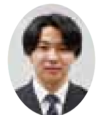
明治大学農学部農学科 進学 (墨田区立本所中学校 出身)

深川高校では、三年間を通して大学受験に向けた進路指導が行われます。一年生では主に小論文対策と文理選択の説明を受けます。私は将来のことをあまり考えたことがなかったため、この機会を通して初めて真剣に考えることができました。二年生では主に先輩講話や三年生の時の選択科目についての説明を受け、本格的に進路の方向性を定める機会が設けられています。私はこの先輩講話をきっかけに受験勉強に熱が入りました。周りの友達には明確にやりたいことが決まって目標に向かって頑張っている人や、そうではない人もいましたが、二年生の後半あたりからは大半の人が受験勉強モードに切り替えて互いに切磋琢磨していました。このような雰囲気は自然につくられるところが深川高校の良いところだと思います。