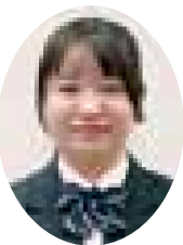
上智大学文学部新聞学科 進学 (江東区立有明中学校 出身)

私が深川高校に入学したいと思った理由は、書道部があるからです。高校を選ぶ上で大学進学実績も重要だと思いますが、結局自分次第だと思ひ、精力的に活動している書道部があることを知り、深川高校に入学しました。