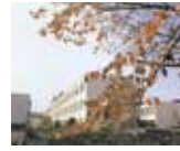
※上記6枚の写真提供 ©恵雅堂