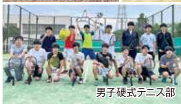
男子硬式テニス部