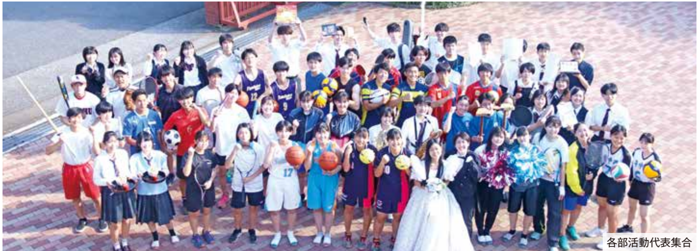
各部活動代表集合