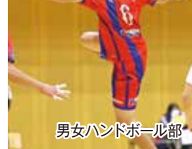
男女ハンドボール部