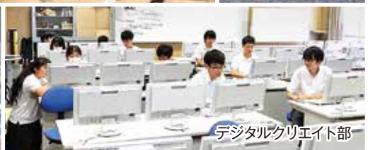
デジタルクリエイイト部