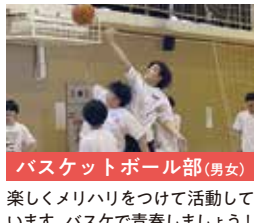
バスケットボール部(男女)

楽しくメリハリをつけて活動しています。バスケで青春しましょう！先輩後輩の仲が良く、明るい雰囲気です！