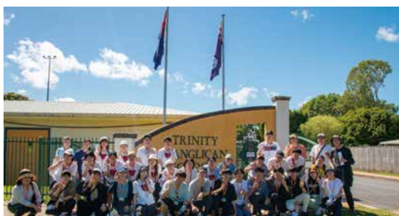
▲ケアンズの提携校(Trinity Anglican School)訪問