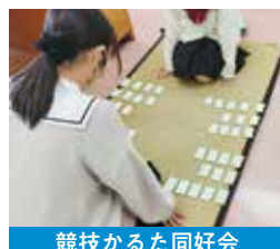
競技かるた同好会