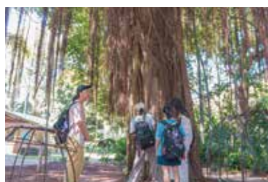
▲ Botanical Gardenでのアクティビティ