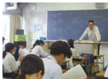
▲ 数学の習熟別授業