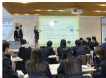
▲ 日本大学文理学部での調布北高校生の発表