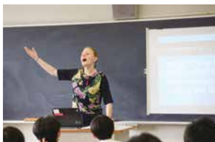
▲JET (外国人の先生)からも学べる「英語」の授業