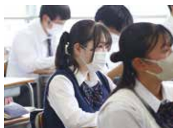
▲ 進路に応じた多様な選択科目

新たな時代に逞しく生きていけるよう生徒に挑戦する気概を醸成していきます。失敗を恥じるのではなく、前向きに挑む姿勢を高く評価し、生徒を激励していく学校にします。校舎改築をマイナスと捉えるのではなく、プラスにしていく逞しい生徒を期待します。