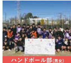
ハンドボール部(男女)