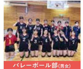
バレーボール部(男女)