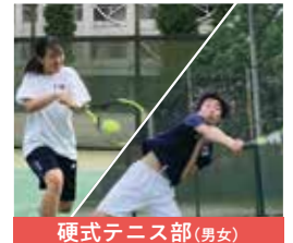
硬式テニス部(男女)