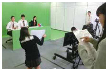
▲ TGG (Tokyo Global Gateway)での体験的学習

※4 ( )内の数字は単位数。選択科目は開講されない場合や変更となる場合もあります。