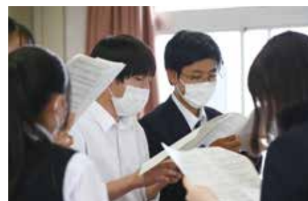
▲「音楽」の授業内での合唱練習