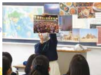
▲ 国際理解講演会(外国人留学生の授業)