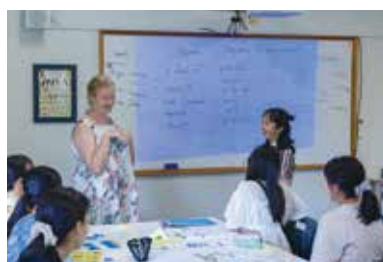
▲ 現地語学学校(Sun Pacific College)での授業