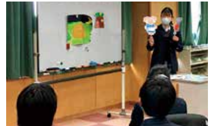
ERP（プレゼンテーション）の授業