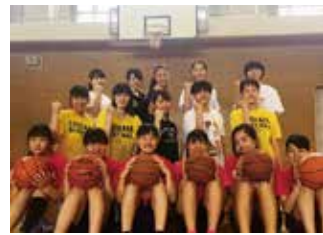
女子バスケットボール部