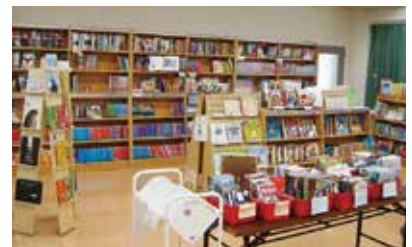
英語書籍（イングリッシュルーム）