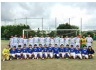
女子サッカー部・男子サッカー部