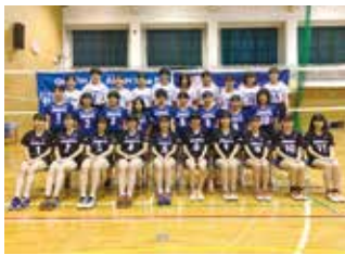
女子バレーボール部