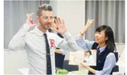
ネイティブスピーカーの授業

高校卒業程度のレベルといわれる実用英語技能検定（英検）の2級をひとつの目標としています。生徒は校内受検やオンライン受験等の機会を活かし、積極的に取り組んでいます。面接練習等、サポート体制もあります。令和4年度は校内受検で49名が2級以上に合格しました。最近では準1級以上を取得する者も出始めています。例年、学年の約半数以上が準2級以上の資格を取得し、卒業していきます。あなたも使える英語から世界へ、挑戦してみませんか。