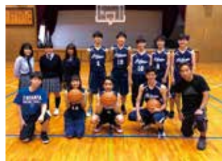
男子バスケットボール部