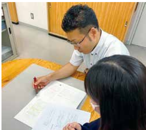
小論文指導説明会