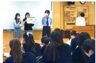
コミュニティデザインの授業