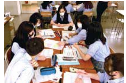
グループワークの授業

国立ベトナム国際大学内において、現地起業家および大学教授をファシリテーターとしたPBL(Project Based Learning)型によるビジネス研修を実施します。PBLとは、少人数グループによる問題発見解決型(事例解決型、事業課題解決型)の学習方法であり、与えられたミッションに対して、現地大学生と英語による実践的なコミュニケーションを取りながら、協働・協力しあい、市場調査からプレゼンテーションに至る一連のマーケティング活動をチームで実践する内容となっています。