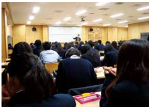
進路ガイダンス全体会