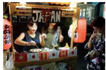
ベトナムビジネススタディツアー