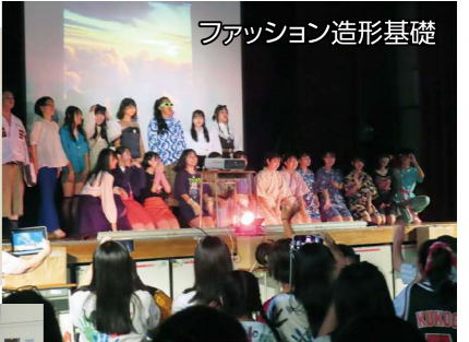
ファッション造形基礎

他校では見られないユニークな授業も。スポーツや文化芸術分野への進学にも対応できます。