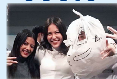
from Italy イタリアより、26期生と共に2022年4月～23年3月の間在学