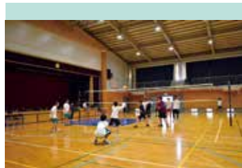
男子バレーボール部