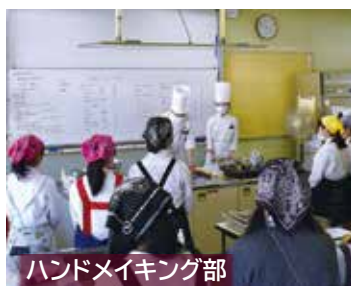
ハンドメイキング部