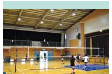
女子バレーボール部