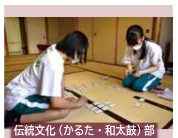
伝統文化(かるた・和太鼓)部