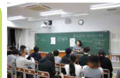
進路指導室において、就職活動の指導を受けている生徒の様子です。