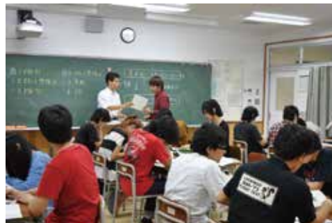
グループで協力する楽しい授業です。