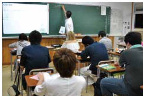
個に応じた丁寧でわかりやすい指導です。