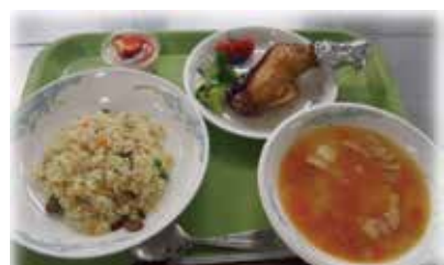
クリスマスのメニューです！