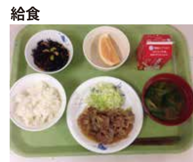
おいしい給食で元気いっぱい！

本校では、昼間に働いてから登校する生徒が多くいます。疲れていても、一生懸命に学ぶ意思をもつ生徒を先生方は応援しています。