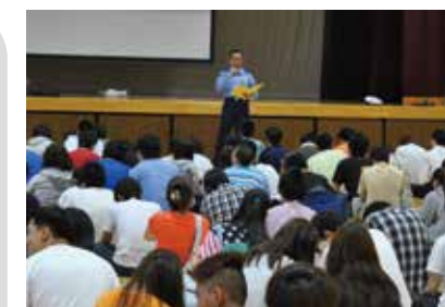
綾瀬警察と連携して、交通安全教室を行ったときの様子です。

学校内のルールを生徒自身が意識して守ることで、安全で楽しい学校生活を送ることができます。卒業して社会へ出たときの規範意識やマナーについても、学校生活の中で、厳しく指導しています。 ☆スクールサポーターと連携した生活指導を行っています。 ☆1年に4回の避難訓練を行い、防災意識を高めています。