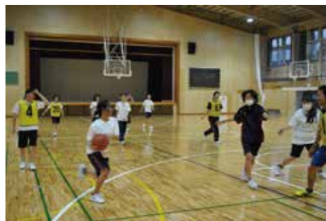
元気に動いて、頭も体もすっきり！