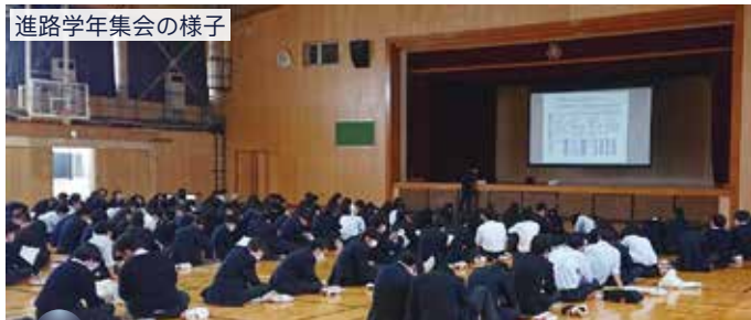
進路学年集会の様子