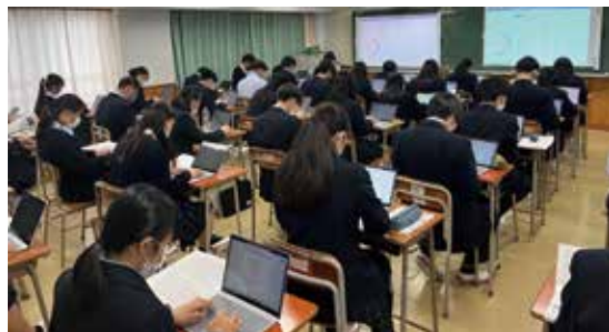
情報 スマスク 端末